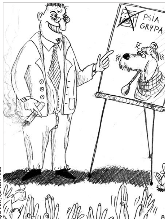
Rys. Patrycja Turowska